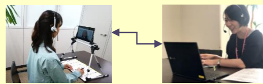
くるめ創業ロケット 博多本部