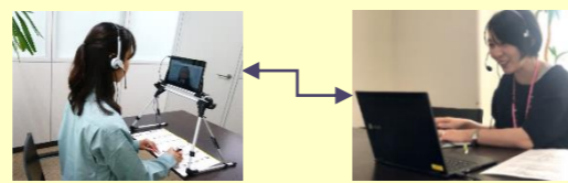
くるめ創業ロケット 博多本部